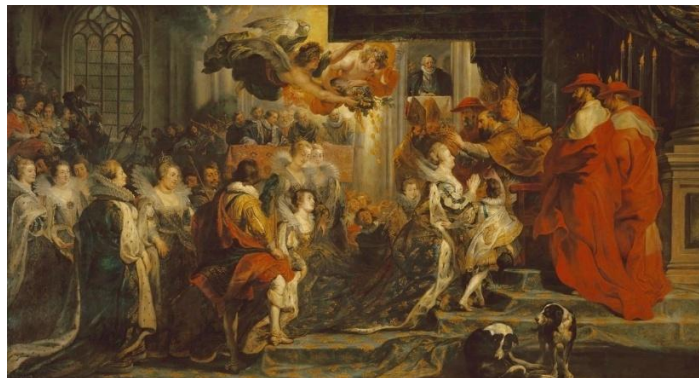
The Queen's Coronation, May 13, 1610 – E.T. / SAIF 2025 colour calibration in front of the work (before the announcement)

A moratorium is essential, and I hope that the Louvre's management and the Ministry of Culture will hear our plea – one that concerns the public interest and our shared heritage.