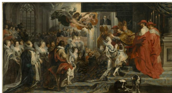
Cf. the colour calibration offered by the press kit, p. 5: "The restoration of the Cycle of Marie de Medici by Peter Paul Rubens" [Sic]