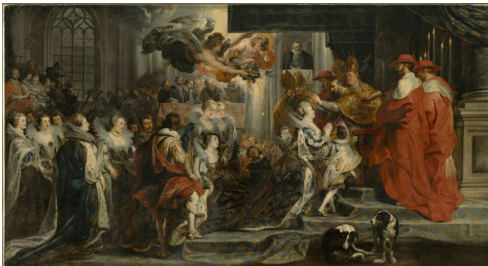
Cf. le réglage offert par le dossier de presse, p. 5 : « La restauration du Cycle de Marie de Médicis par Pierre Paul Rubens » [Sic]