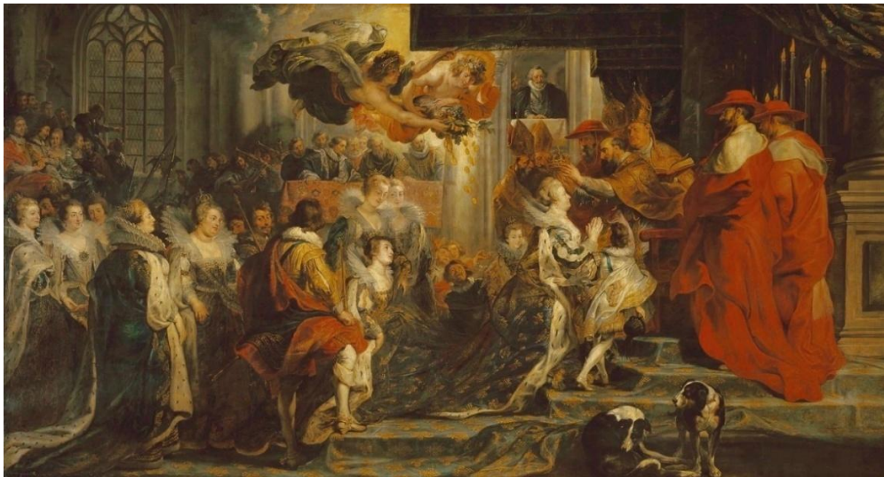
Le Couronnement de la Reine, le 13 mai 1610 – Réglage E.T. / SAIF 2025 devant l'œuvre (avant l'annonce)

Un moratoire s'impose et j'espère que la direction du Louvre et le ministère de la Culture voudront bien entendre notre supplique qui touche à l'intérêt général et à notre patrimoine commun.