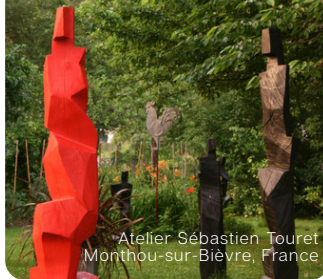
Atelier Sébastien Touret Monthou-sur-Bievre, France